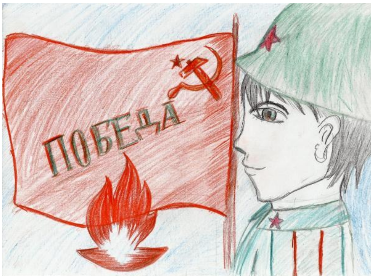
« Мы помним...мы чтим...» Рисунок Смирнова Никиты