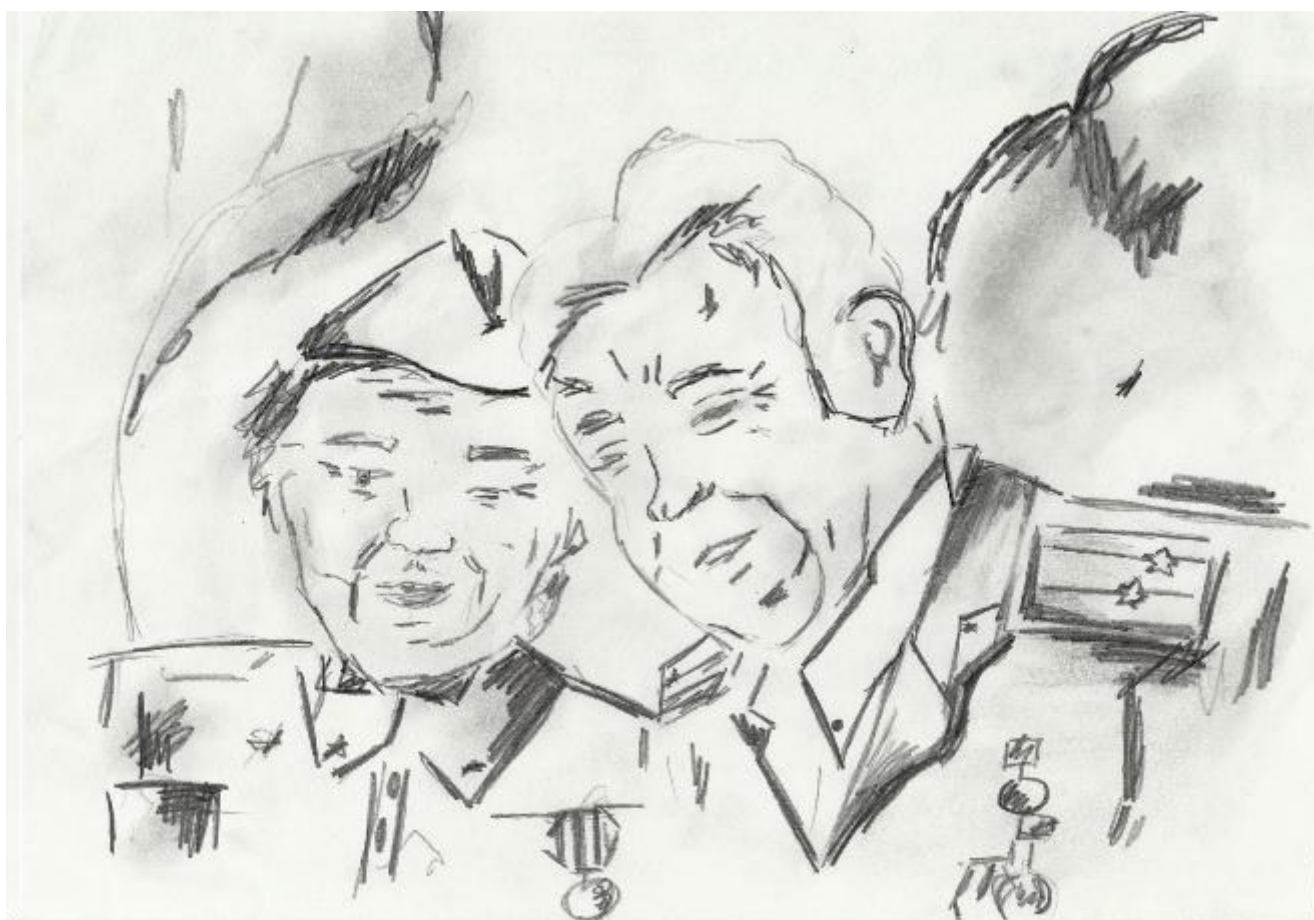
«Улыбки ветеранов» Рисунок Морозовой Екатерины