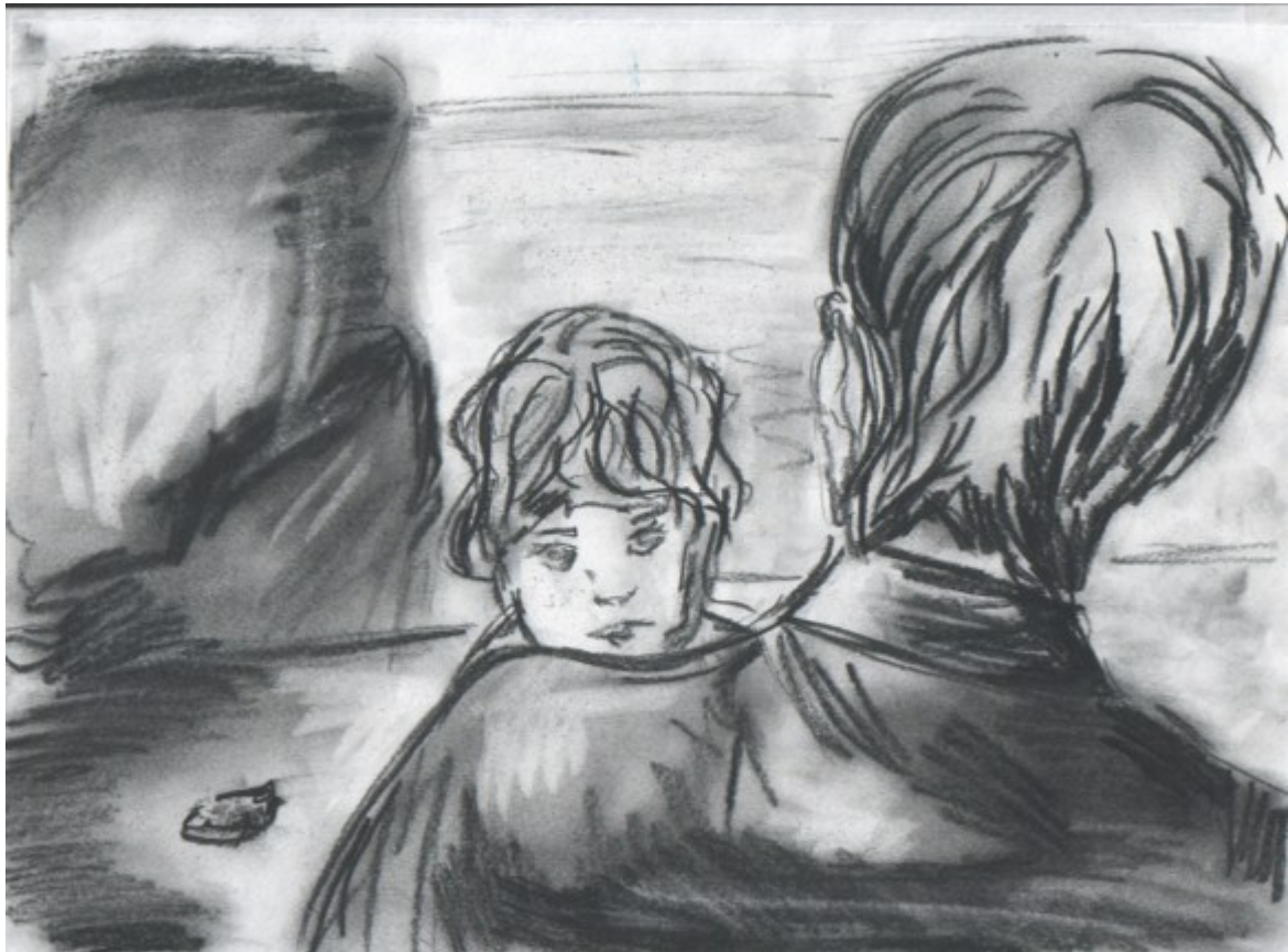
«Не бойся, малышка»